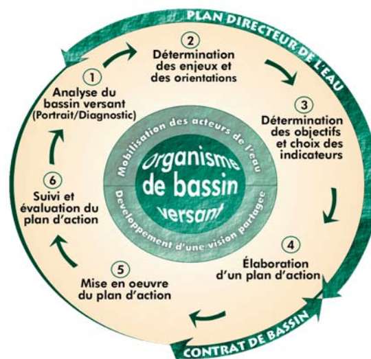
Le cycle de gestion intégrée de l'eau par bassin versant

La gestion intégrée de l'eau par bassin versant se base sur l'élaboration d'un Plan Directeur de l'eau établi à l'échelle du bassin versant. Ce document constitue le fondement de tout organisme de bassin versant.